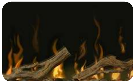
50" Комплекты принадлежностей Driftwood и River Rock (LF100DWS-KIT)