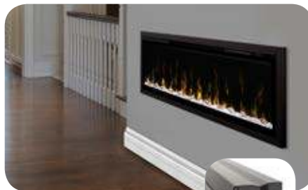
Отделочный комплект 50" IgniteXL (XLFTRIM50) Предназначен для встраивания в стену 2" x 4", 52-3/4" x 18-1/4" x 1-7/8" (134.0 см x 46.2 см x 4.5 см)

120 вольт | 1,500 Ватт | 5,118 БТЕ 240 вольт | 2,500 Ватт | 8,530 БТЕ